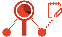
Gelişmiş Sorgulama ve Raporlama