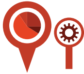
Mekansal ve Sözel Veri Yönetimi