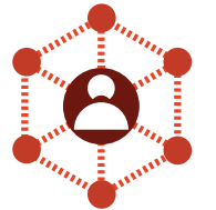
Kullanıcı ve Yetki Yönetimi